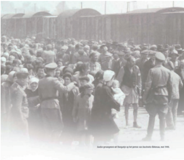
Joodse gevangenen op het perron van Auschwitz-Birkenau, mei 1944.