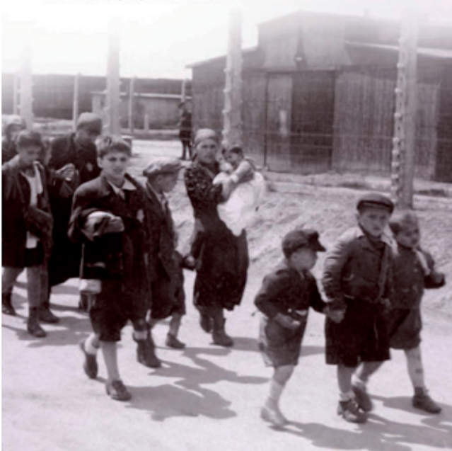
Joodse moeders en kinderen op weg naar de gaskamer in Auschwitz-Birkenau, mei 1944.

In Duitsland en in de bezette gebieden bouwen de nazi's honderden concentratiekampen waar miljoenen gevangenen dwangarbeid moeten verrichten. Er zijn ook vernietigingskampen waar alle gevangenen direct na aankomst in gaskamers vermoord worden. En dan zijn er ook nog concentratiekampen waar geen gaskamers zijn, zoals Bergen-Belsen. In die kampen bezwijken duizenden gevangenen aan uitputting door de zware dwangarbeid of aan ziekte. De hygiënische omstandigheden in die kampen zijn slecht en er is veel te weinig voedsel.