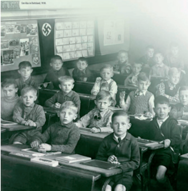
Een klas in Duitsland, 1938.

Vanaf april 1933 ontnemen de nazi's de joden in Duitsland stap voor stap hun rechten. Joodse leerkrachten en ambtenaren worden ontslagen. In september 1935 bepalen de nazi's via officiële 'rassenwetten' wie 'jood' is, dat joden minder rechten hebben en dat joden en niet-joden niet meer met elkaar mogen trouwen of een relatie mogen hebben. Joodse Duitsers worden zo tweederangsburgers in hun eigen land.