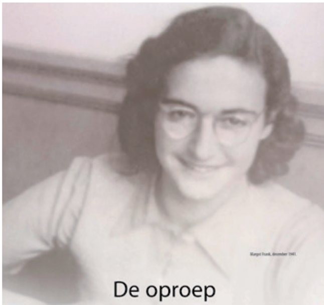
Margot Frank, december 1941.