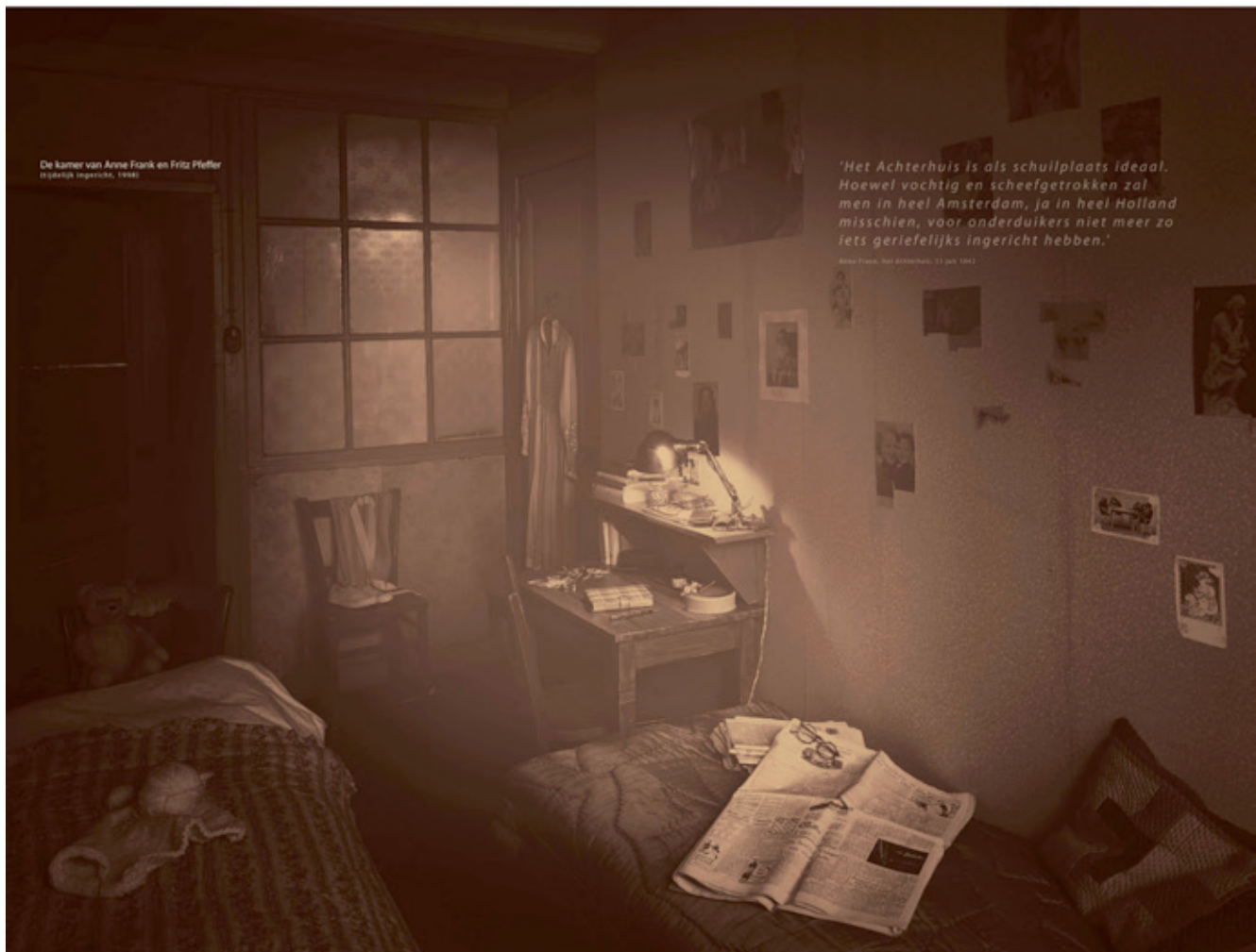
De kamer van Anne Frank en Fritz Pfeffer tijdelijk ingericht, 1998

'Het Achterhuis is als schuilplaats ideaal. Hoewel vochtig en scheefgetrokken zal men in heel Amsterdam, ja in heel Holland misschien, voor onderduikers niet meer zo iets geriefelijks ingericht hebben.'