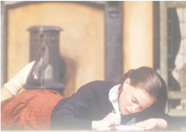
Natalie Portman als Anne Frank in het toneelstuk 'The Diary of Anne Frank', 1997.