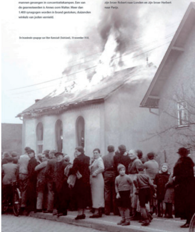
De brandende synagoge van Ober-Ramstadt (Duitsland), 10 november 1938.