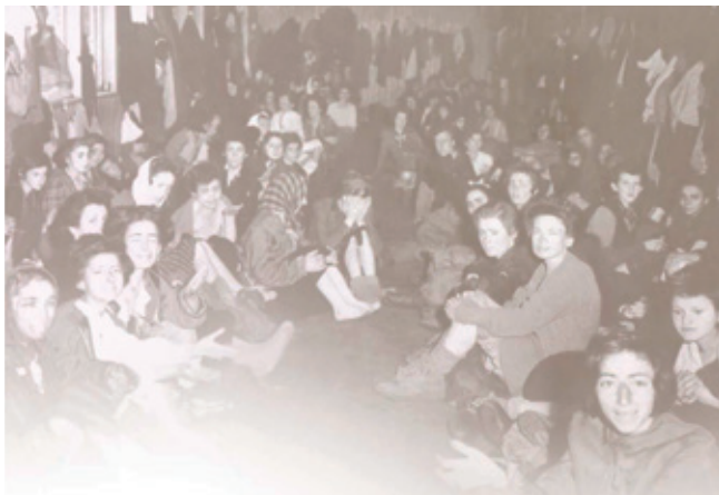
Overlevenden in het kamp Bergen-Belsen, april 1945. Na de bevrijding sterven nog veel mensen aan de gevolgen van hun gevangenschap.