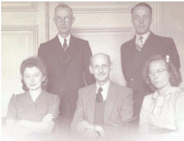
1945 – heden