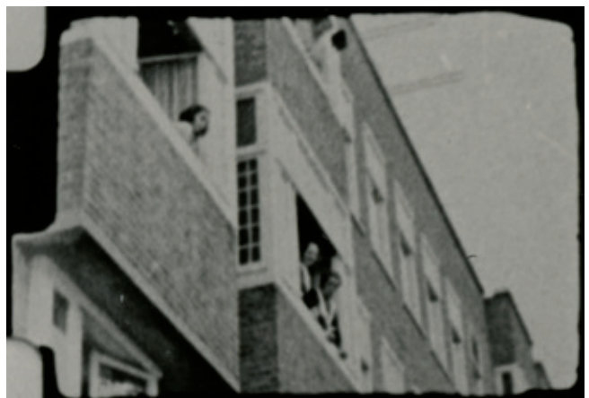
^ Dit zijn de enige bewegende beelden van Anne Frank. In 1941 is zij toevallig gefilmd toen de dochter van haar burens ging trouwen.

Wij leven nu in een andere tijd. Er zijn grote verschillen tussen toen en nu, maar discriminatie en uitsluiting zijn na de Tweede Wereldoorlog niet verdwenen. In het tweede gedeelte van de tentoonstelling vertellen jongeren hoe zij daarop reageren.