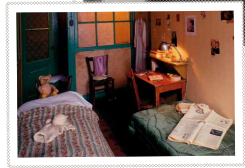
LA PEQUEÑA HABITACIÓN DE ANA FRANK Y FRITZ PFEFFER, AMUEBLADA TEMPORALMENTE PARA FILMACIONES.