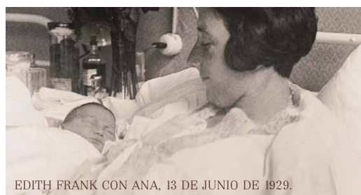
EDITH FRANK CON ANA, 13 DE JUNIO DE 1929.

EL DIARIO DE ANA QUE LE REGALARON CUANDO CUMPLIÓ TRECE AÑOS.