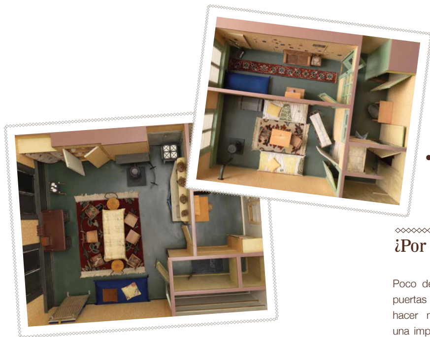
LAS MAQUETAS QUE OTTO FRANK MANDÓ A HACER EN 1960 DAN UNA BUENA IMPRESIÓN DE LA DISTRIBUCIÓN DEL REFUGIO.